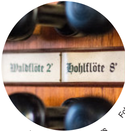
Teil des Orgelregisters