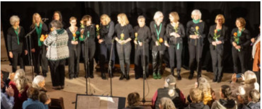
Rosen für alle nach einem wunderbaren Konzert

Schon weit vor dem Einlass kamen Besucher zur Alten Kirche. Nachdem die Abendkasse installiert und die Chorprobe beendet war, konnten die ersten Besucher in die Kirche eingelassen werden. Immer mehr füllte sich das Kirchenschiff und letztlich sogar noch die Emporen. Welch ein besonderer Anblick!